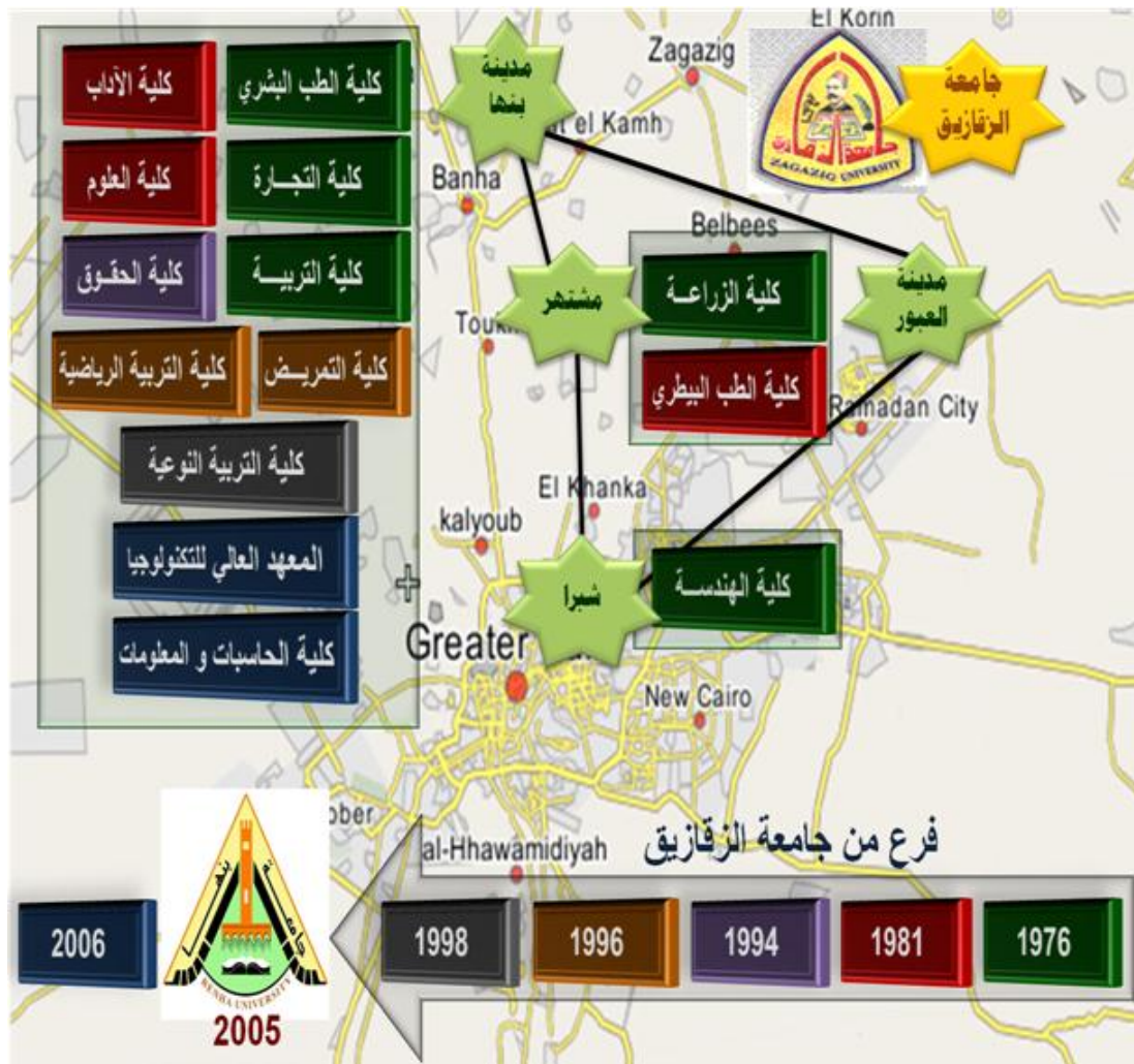
توزيع كليات و معاهد جامعة بنها في محافظة القليوبية