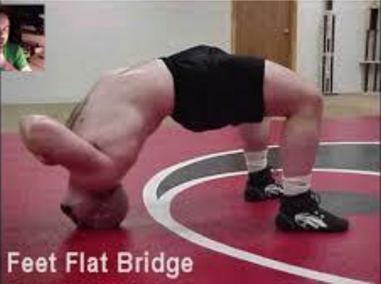
Feet Flat Bridge